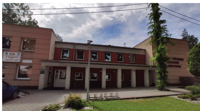
GOK w Bestwinie

Kontakt z pracownikami GOK od poniedziałku do piątku w godz. 7.30 – 15.30 pod numerami telefonów 32 214 13 65; 32 214 15 87