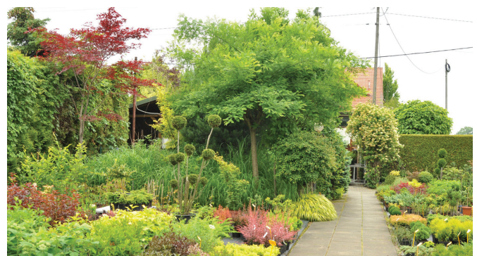
W szkółce można nabyć wiele gatunków roślin