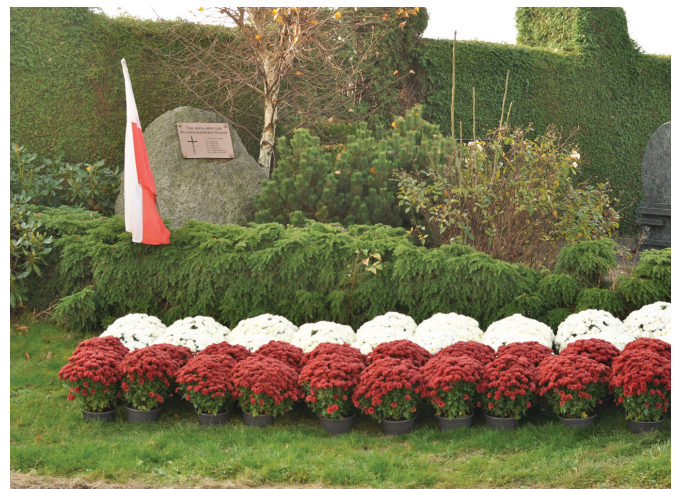
Pomnik na cmentarzu w Bestwinie