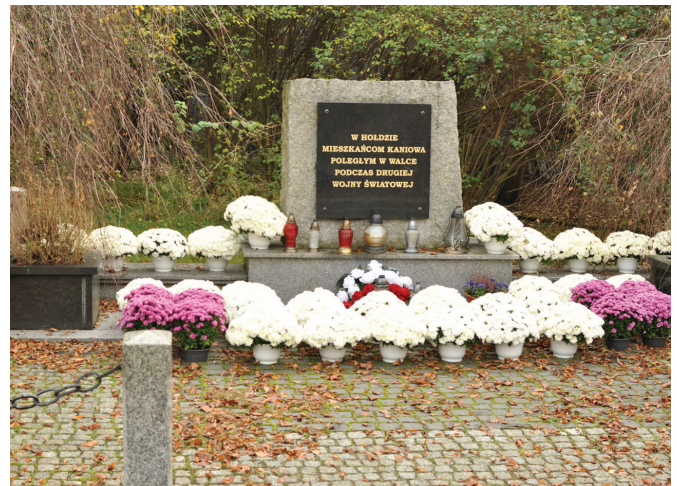
Pomnik w centrum Kaniowa