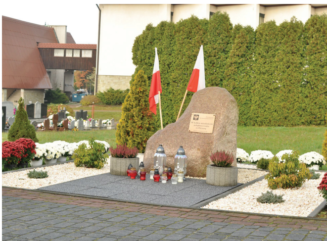
Pomnik na cmentarzu w Janowicach