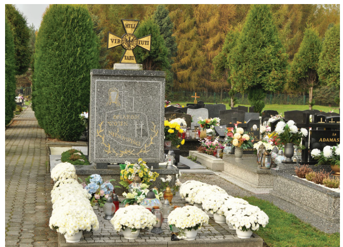
Pomnik na cmentarzu w Kaniowie