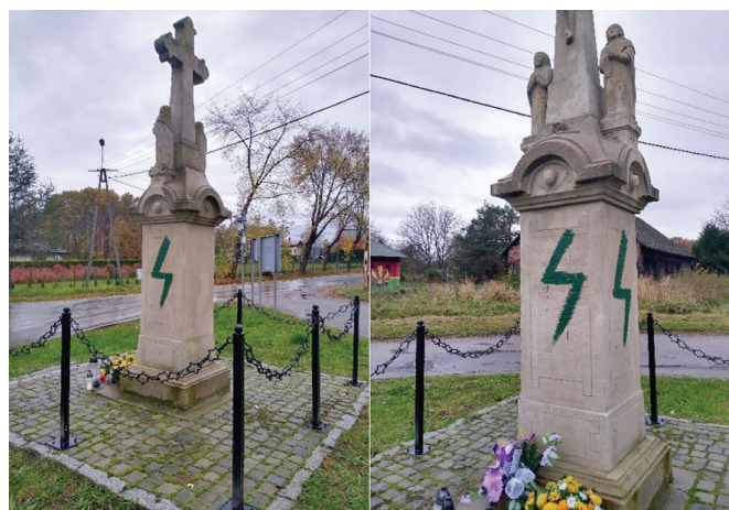
Zdewastowana kapliczka w Janowicach

„Nie rozumiem!!! Można protestować, mieć własne zdanie, poglądy... Ale dla dewastacji NIGDY nie będzie mojej zgody. Czy to rozbita szyba przystankowa, złamany znak, wyrwiona